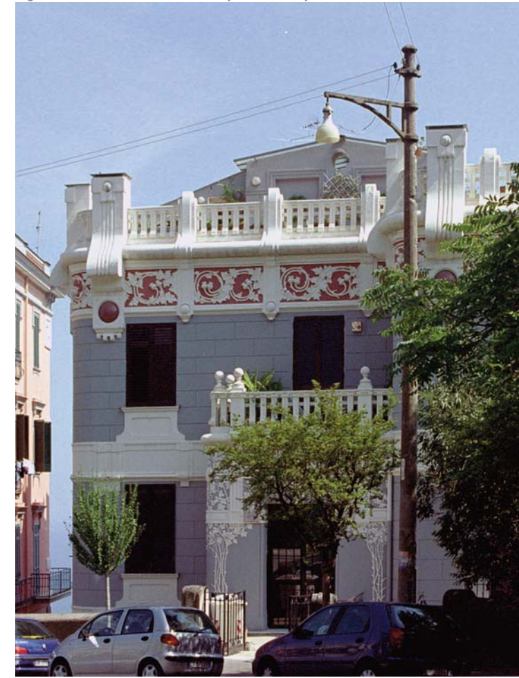
Quartiere Art Nouveau (style Liberty)