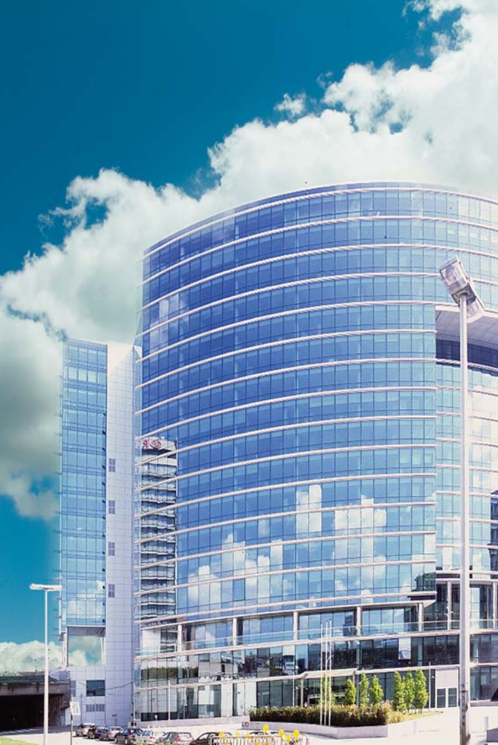
Bruxelles Quartiere U.E.