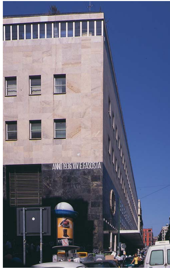
Posta Centrale (Architettura Fascista 1936)